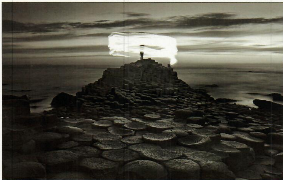
Giant's Causeway and figure, Northern Ireland, 2018